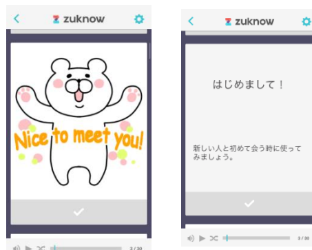
「Chatty」で使用されているスタンプの単語カード 表・裏

「Chatty ( http://chatty-r.com/ )」は、“しゃべらなくていい”英会話をコンセプトに、チャットを通して英語を楽しく学べるスタンプ英会話アプリです。zuknow を使うと、英会話初心者の方でも「Chatty」で使用されるスタンプとフレーズの意味を楽しみながら学習でき、実際の「Chatty」でもスムーズな会話を楽しめます。